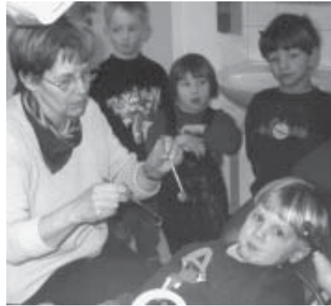
Die Kinder der Gelben Gruppe aus Bant II waren zu einem Besuch beim jugendärztlichen Dienst im Gesundheitsamt.