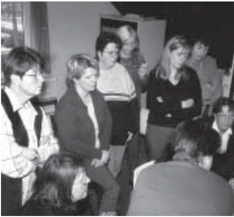
Der Computerkurs in der Kirchengemeinde Bant machte die Erzieherinnen fit für die neuen Computer in der Kindertagesstätte Bant II.