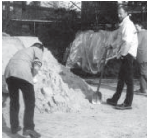
In beiden Banter Kindergärten wurde im April das erste Mal eine Frühjahrsputz-Aktion mit Kindern, Eltern und Erzieherinnen durchgeführt. Bei herrlichem Wetter wurde der Sand erneuert, Unkraut gejätet, gefegt und geharkt. Die Aktion begeisterte und wird auf jeden Fall wiederholt.