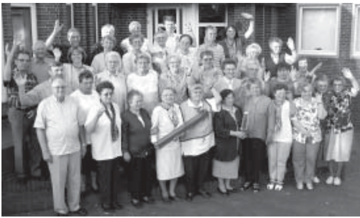
Eine Seniorengruppe aus der Kirchengemeinde Ruhland in der schlesischen Oberlausitz war über Himmelfahrt in Bant zu Gast. Alte Freundschaften wurden erneuert und neue Kontakte geknüpft.